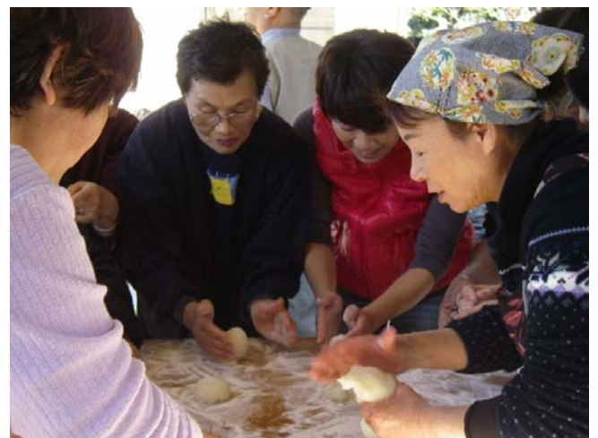
こうしてまるめてね