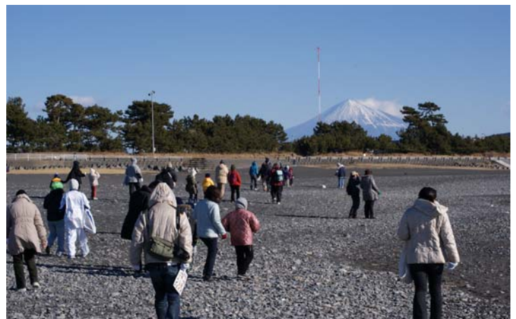
大浜で富士山を望みながら