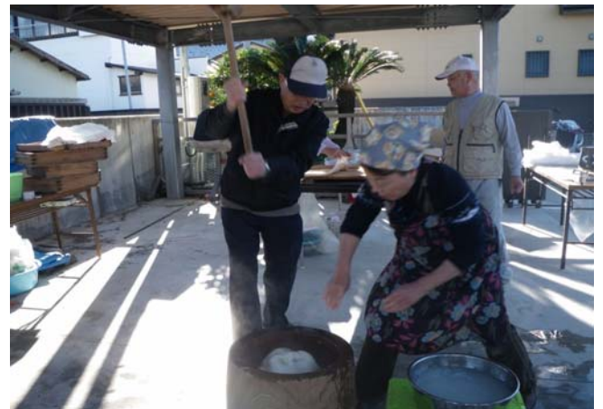
息も、意気もピツタシ！