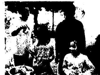
中島中学PTAバザー 「ギョウロウとくづくり体験」